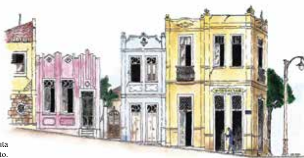
A aguarela ao lado retrata o casario da época, cuja luta pela preservação era uma das bandeiras de Lima Barreto.